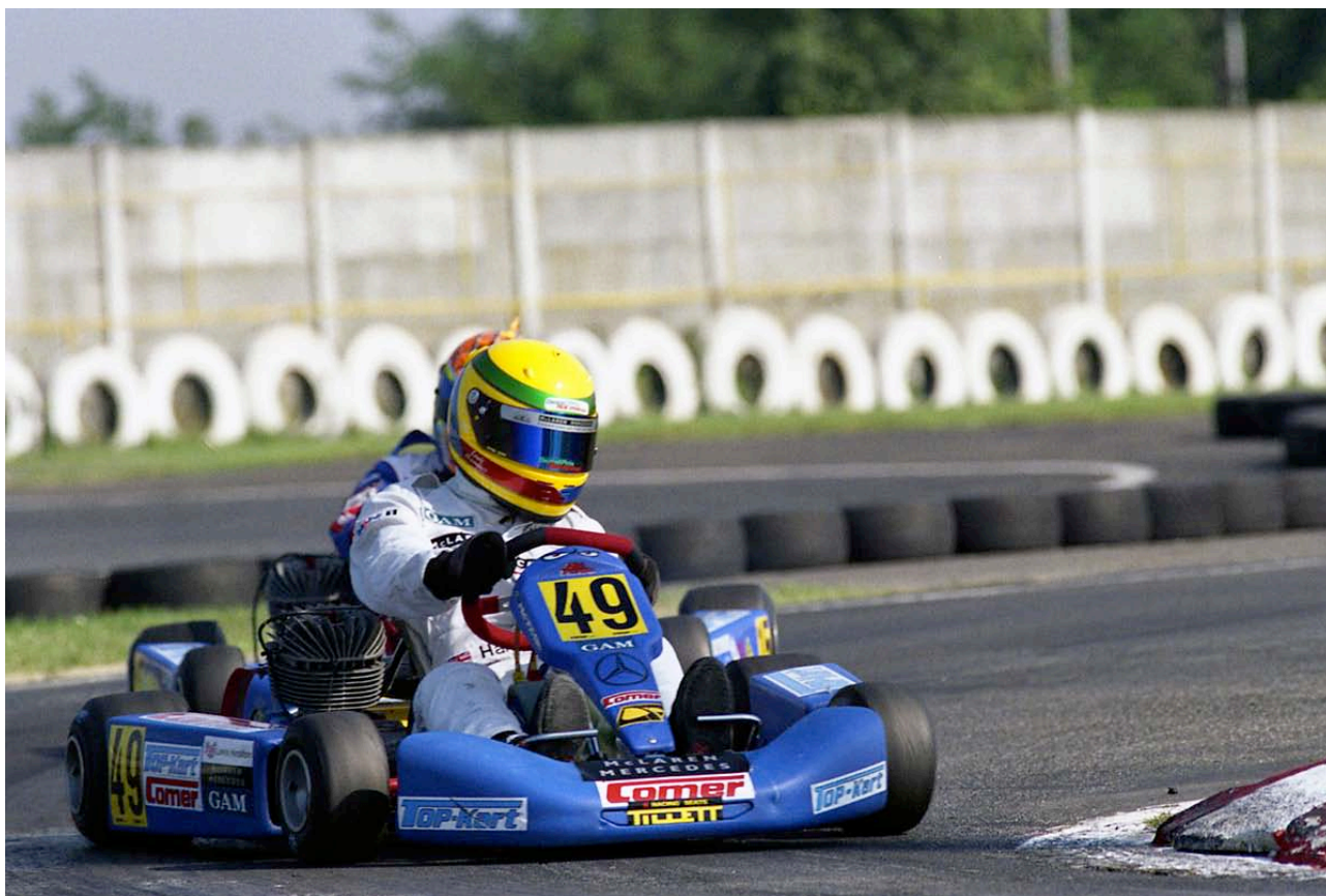
(Lewis Hamilton, 1999)

Fra questi, tre piloti in seguito diventeranno Campioni del Mondo in Formula 1: Fernando Alonso (2005-2006), Lewis Hamilton (2008) e Sebastian Vettel (2010-2011-2012-2013).